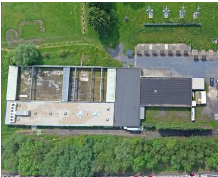
Les nouvelles installations vues d'en-haut. A côté des lignes de tir à ciel ouvert se trouvent les 8 lignes désormais couvertes.

Ce n'est là qu'un projet mené à bien parmi d'autres car Intertir accueille les sociétés locales, folkloriques et autres, qui possèdent des adeptes d'autres formules de tir telles que le tir à air comprimé ou le tir à la grosse carabine sur cibles perchées. D'ailleurs, deux nouveaux stands de tir à la perche ont été ajoutés aux deux préalablement existant et totalement rénovés. « La crise du Covid a évidemment ralenti les travaux. Ainsi, la couverture du site et les chantiers annexes ont débuté en novembre 2019. Et voilà à peine qu'ils se terminent, bien qu'il reste encore quelques détails à régler », souligne Günther